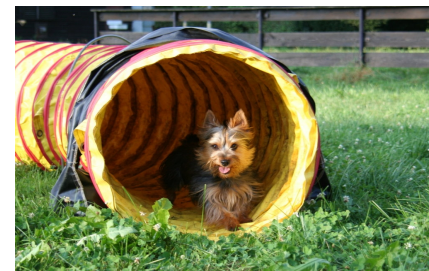
Sisco beim Agilitytraining

Sein unkompliziertes, lustiges Wesen, seine „handliche“ Größe und nicht zuletzt die relativ einfache Fellpflege machen ihn zu einem auch für die Großstadt geeigneten Hundepartner.