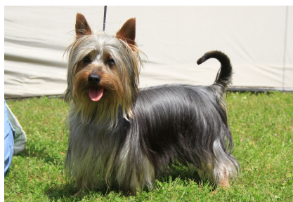
Creekvalley Breath of Live „Dobby“

Trotz seines attraktiven Aussehens ist er ein echter Terrier und stellt eine glückliche Mischung aus dem kleineren Yorkshire und dem robusteren, etwas größeren Australian-Terrier dar.